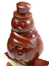
Bonhomme de neige